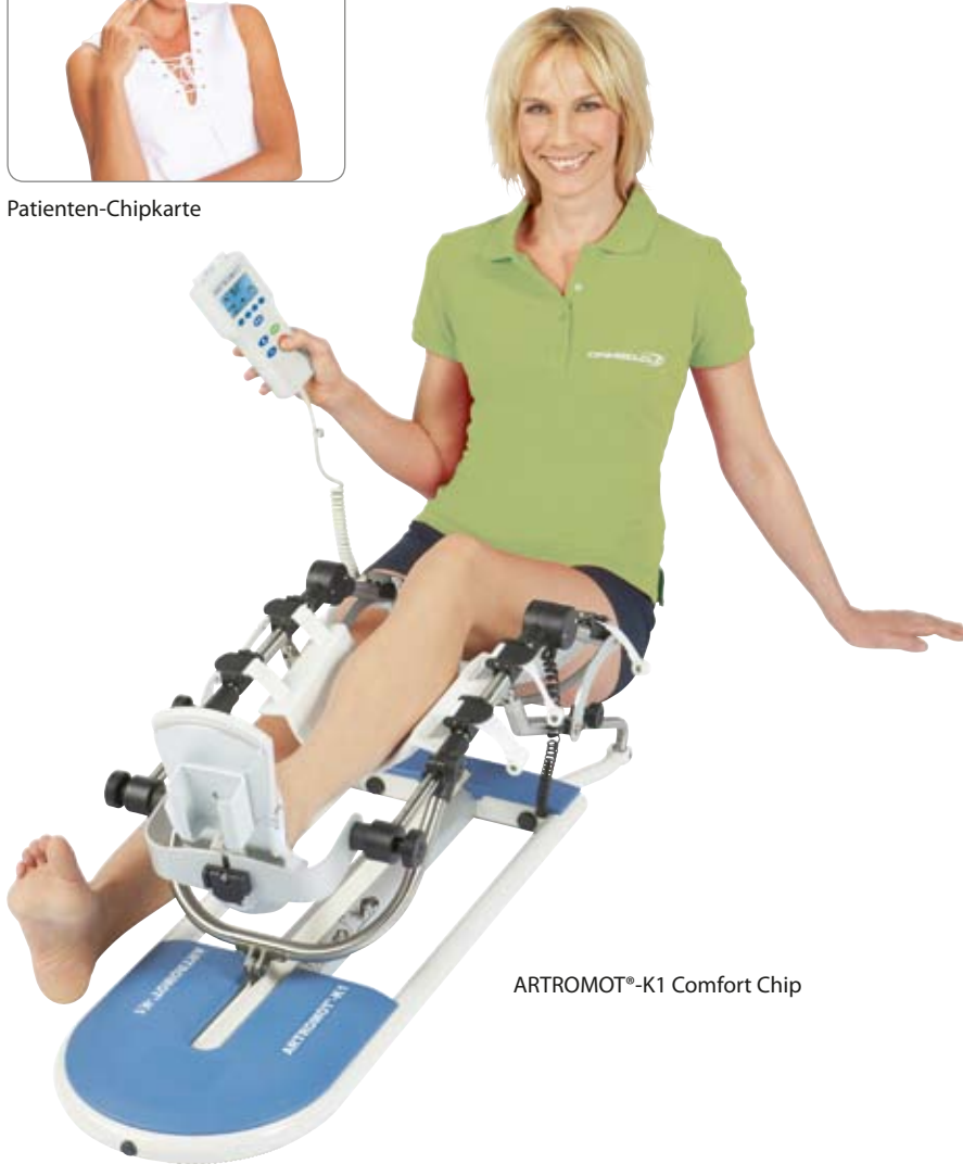
ARTROMOT®-K1 Comfort Chip