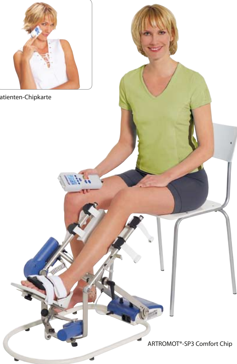
ARTROMOT®-SP3 Comfort Chip