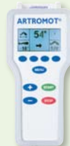
Hand-Programmiereinheit ARTROMOT®-K1 Standard ARTROMOT®-K1 Comfort