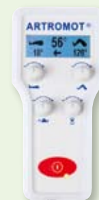
Hand-Programmiereinheit ARTROMOT®-K1 Classic